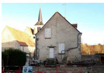
Futur stationnement pour PMR