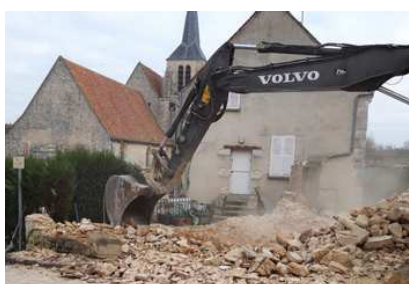
En chantier, je m'appelle Teuse !

Les travaux de réhabilitation de la mairie ont débuté. Tout d'abord, l'ancienne maison vétuste et insalubre de la route de Bennes a été détruite afin de pouvoir réaliser des emplacements de stationnement pour Personnes à Mobilité Réduite. L'accès des PMR à la salle de conseil se fera à l'aide d'une passerelle située à ce niveau. La suite du chantier se situe à l'intérieur du bâtiment avec la démolition des planchers, cloisons inutiles, etc. afin de permettre une rénovation de qualité.